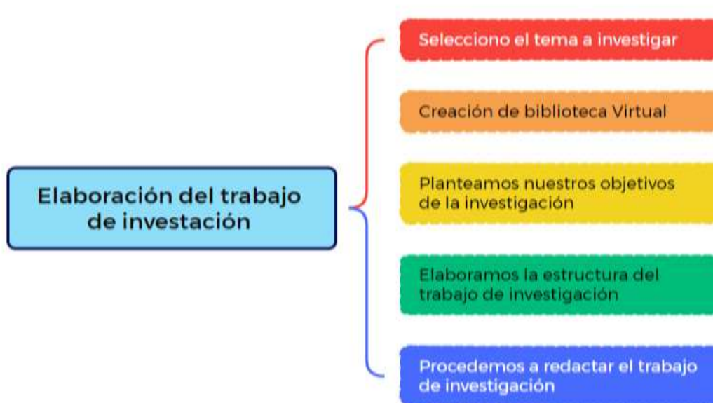
Figura N°01. Secuencia de elaboración del trabajo de investigación

Nota. Elaboración del trabajo de investigación