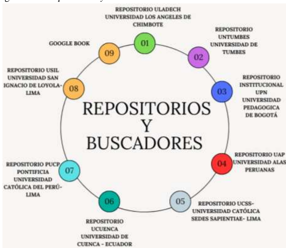
Figura N°02 Repositorios y buscadores Académicos

Utilizando la tecnología ingresamos a CONCYTEC y repositorios con el buscador colocamos palabras claves como, que es aprendizaje, aprendizaje significativo, teorías de aprendizaje significativo, etc. y nos aparece las distintas investigaciones, otra opción es ir a búsqueda avanzada donde colocamos autor, año y el tema y le damos buscar y nos arroja la información solicitada.