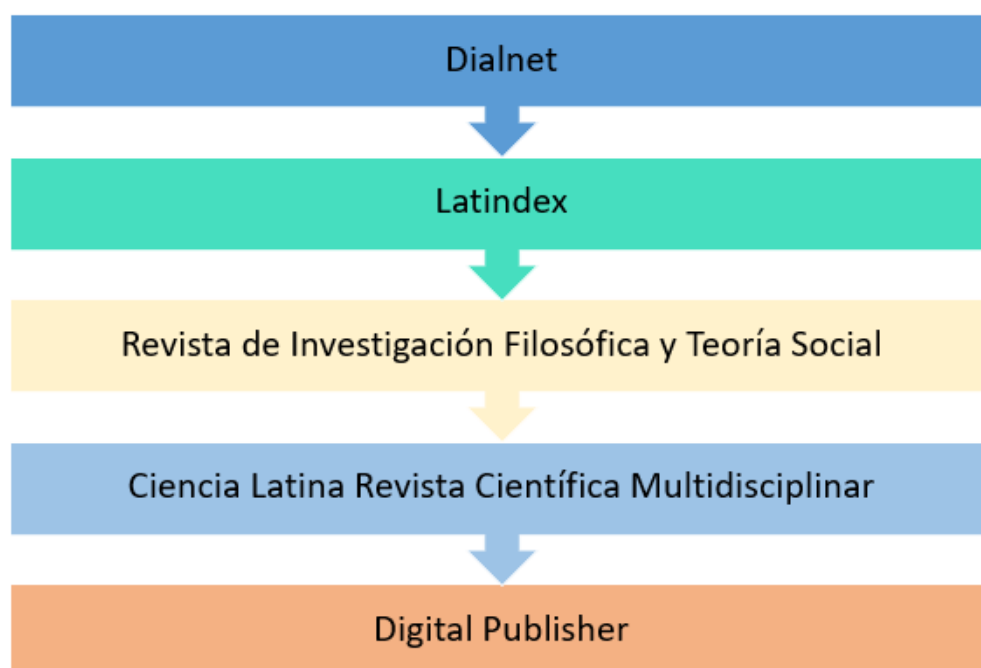
Figura N°03 Revistas Internacionales.

En cuanto a revistas se incluyeron a: Dialnet, Latindex, Revista de Investigación Filosófica y Teoría Social, Ciencia Latina Revista Científica Multidisciplinar, Digital Publisher.