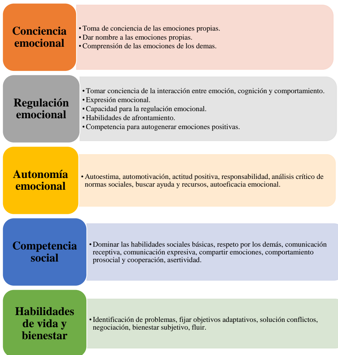
Figura 2: Habilidades Socioemocionales según Bisquerra

Nota: Detalle de las habilidades socioemocionales y sus componentes.