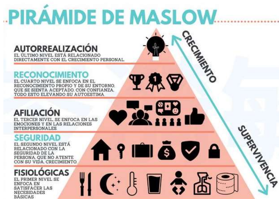
Figura 3: Pirámide de Maslow

Nota: Las necesidades de Maslow Fuente: Rodulfo( 2018)