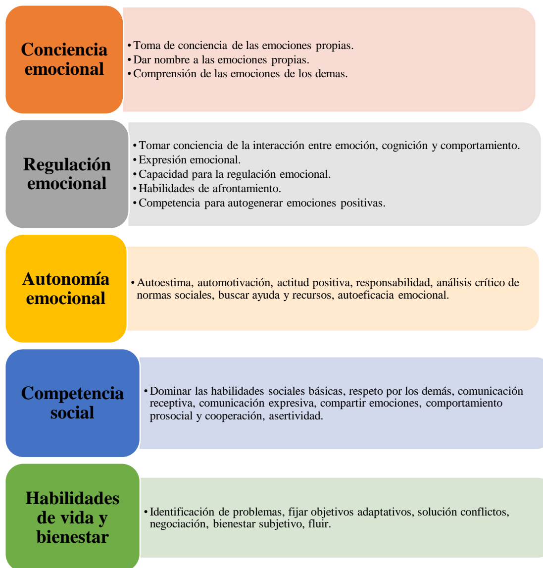
Figura 2: Habilidades Socioemocionales según Bisquerra

Nota: Detalle de las habilidades socioemocionales y sus componentes.