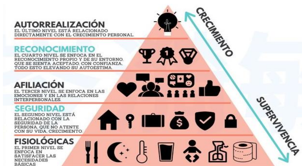
Figura 3: Pirámide de Maslow

Nota: Las necesidades de Maslow