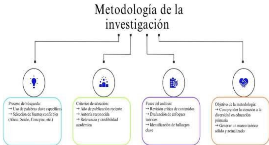
Figura 4 Proceso Metodológico de la Investigación

Nota: Información sintetizada acerca de la metodología de la investigación académica