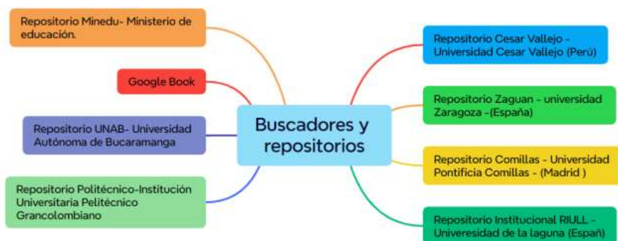
Figura 2 Buscadores y repositorios

Nota. Bibliotecas digitales