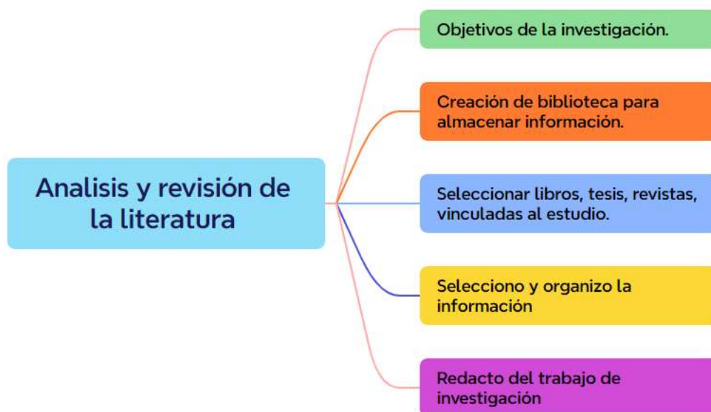
Figura 1 Esquema Metodológico de la Investigación

Nota. Estructura del trabajo de investigación