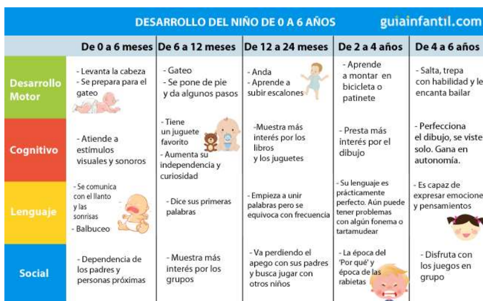
Tabla de evolución del niño

Nota: tabla de desarrollo de los niños de los 0 a los 6 años